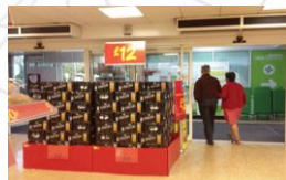
Espositore fuori scaffale all'ingresso