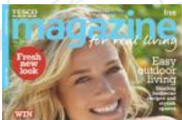
Promozioni nella rivista del distributore