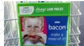
Pubblicità sul carrello