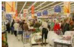
Banners sul soffitto