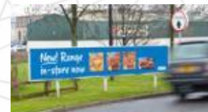
Posters nel parcheggio